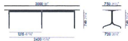
Tisch rechteckig, 3000 x 750 mm